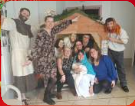
L'équipe des Fleurs