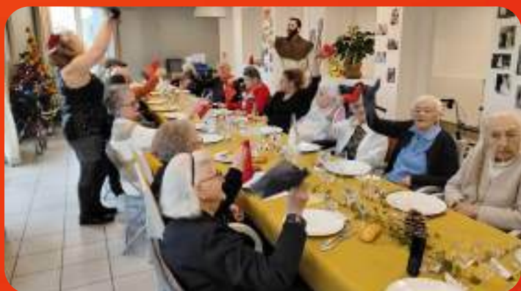
🎵 Et on fait tourné les serviettes !!