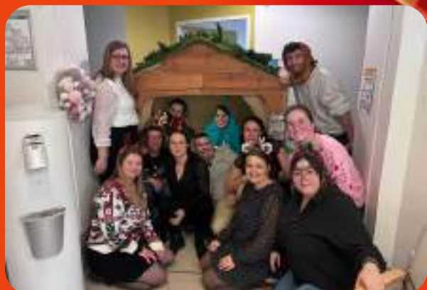
L'équipe des Oiseaux