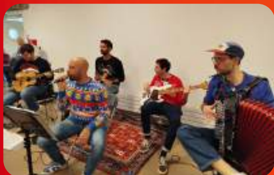
L'orchestre "les 5 Gars" enflamme la piste