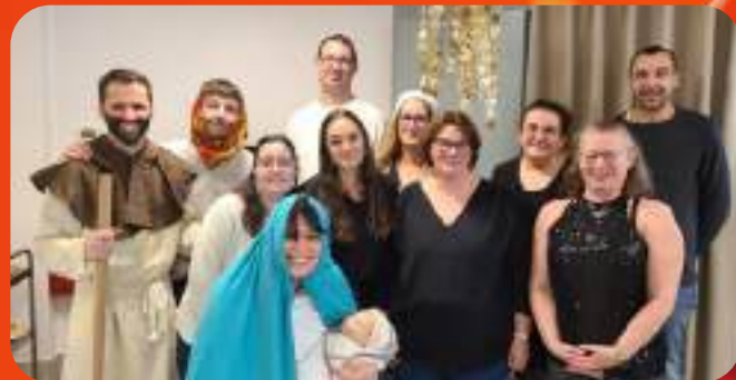
L'équipe des Vieux Métiers et l'entretien