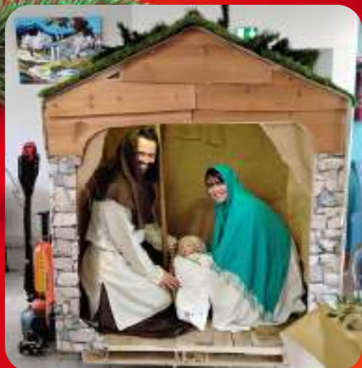
La crèche vivante rend visite à chaque hameau