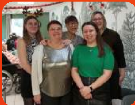
L'équipe de la Forêt