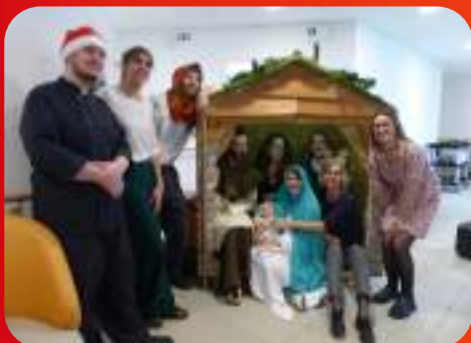
L'équipe de la Résidence Autonomie