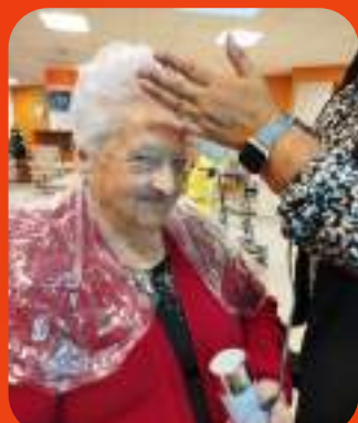
La coiffeuse et la maquilleuse préparent toutes les résidentes