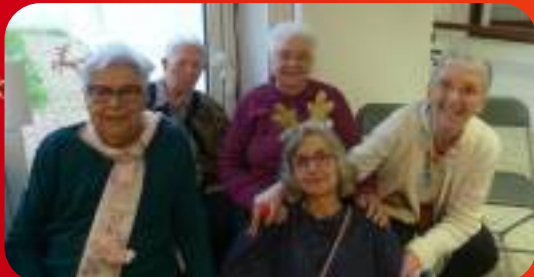
L'équipe de la Rivière