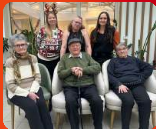
Les résidents et l'équipe de l'accueil de jour