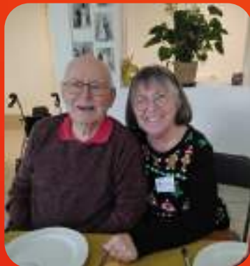
L'équipe du Bois du Ruleau