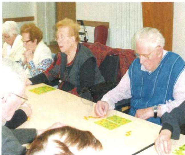
Loto du téléthon à Belleville