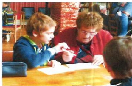
Fête des Anniversaires, avec CHOEURS JOYEU