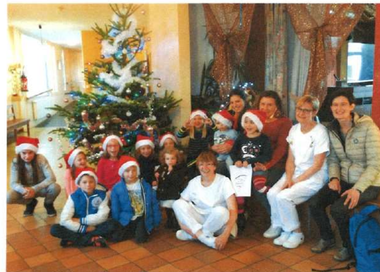
Goûter avec les enfants du personnel et les résidents dans le hall.