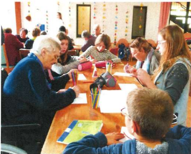
COLORIAGE avec les enfants du collège de PALLUAU