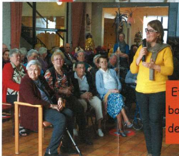
Et pour finir dans la bonne humeur, le goûter de Noël...! Dans le hall.