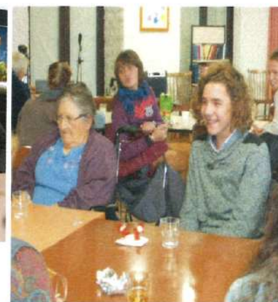
Les jeunes du collège Ste Marie, dans le hall