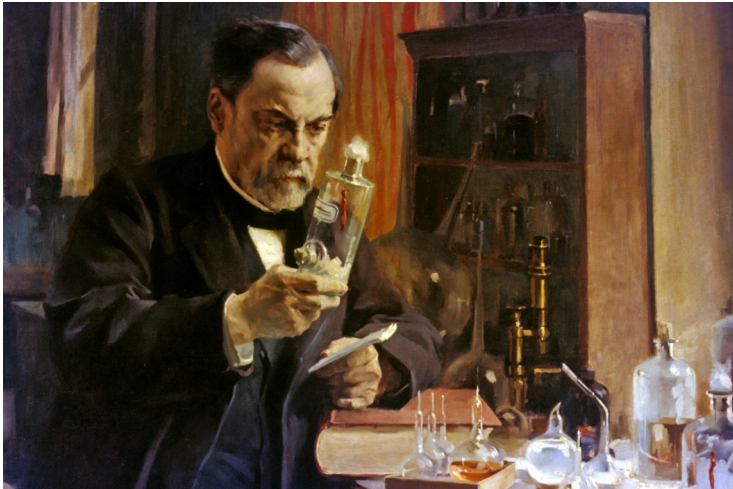
LOUIS PASTEUR (1822-1895)

De nos jours, la Diphtérie qui est également une infection respiratoire est une maladie qui n'existe quasiment plus grâce au vaccin obligatoire. Le coronavirus subira forcément le même sort...