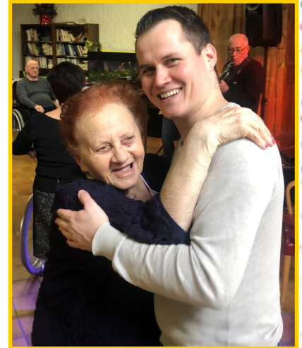
La musique bat son plein sur des airs joyeux qui donnent envie de danser. Le temps d'une valse ou d'un tango chacun se laisse porter en oubliant les tracas de la vie.