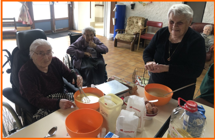
Les dames sont aux fourneaux pour ravir nos papilles!