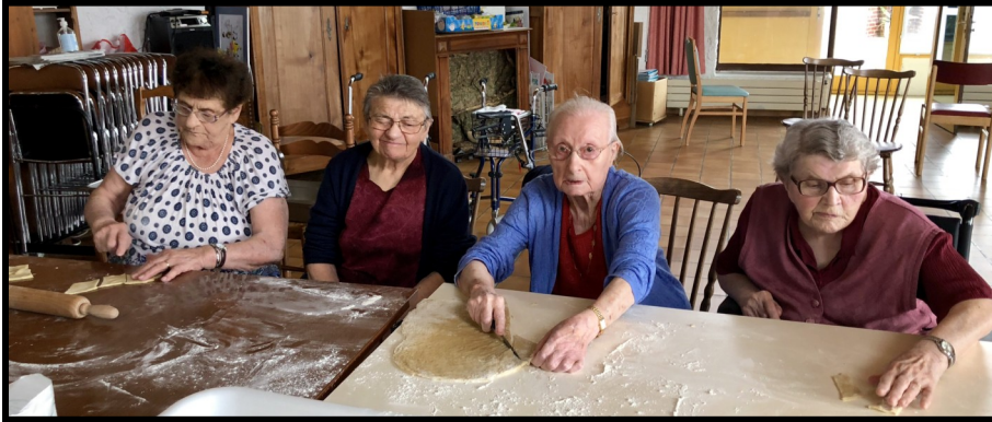
Préparations des bottereaux pour la vente, merci mesdames!