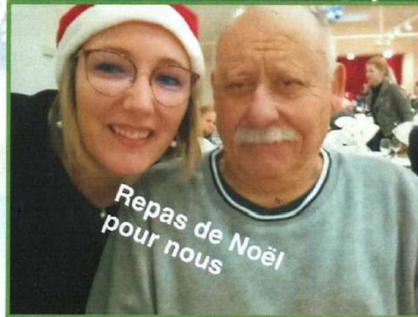
Repas de Noël pour nous

MERCI à tous les commerçants, prestataires et partenaires pour leur générosité concernant le loto du mois d'octobre. Merci également aux familles, salariés, bénévoles et joueurs. L'argent récolté a en partie servi au financement de cette belle journée! BRAVO !