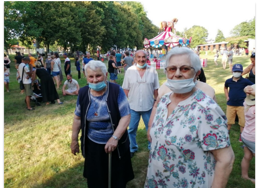
LES RÉSIDENTS SONT À LA FÊTE FORAINE POUR LES MARDYNAMIQUES