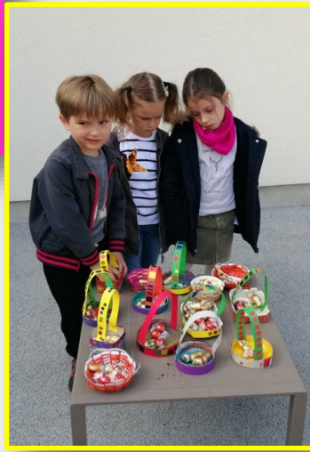
Petite pose pour les enfants devant les chocolats apporté par les cloches !