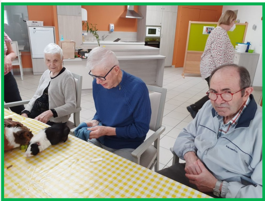
Une petite carotte ?