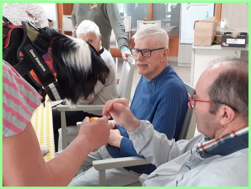
Le chien Rio à toujours beaucoup de succès