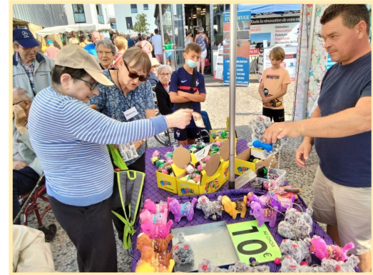
Durant l'été, nous avons visité le marché de Brétignolles Sur Mer