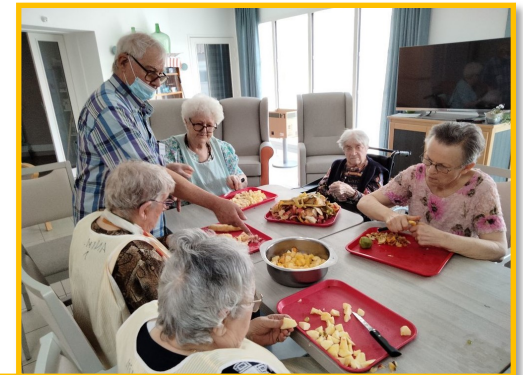
Puis nous avons réalisé une salade de fruits avec les produits achetés sur le marché Humm quel délice !